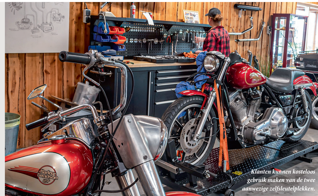
Klanten kunnen kosteloos gebruik maken van de twee aanwezige zelfseutelplekken.