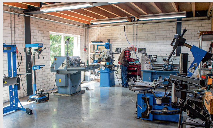
De werkplaats is nog wel het warmst kloppende hart van het bedrijf, met overall strategisch opgestelde werkbanken, hefbruggen en hoogwaardige machines.