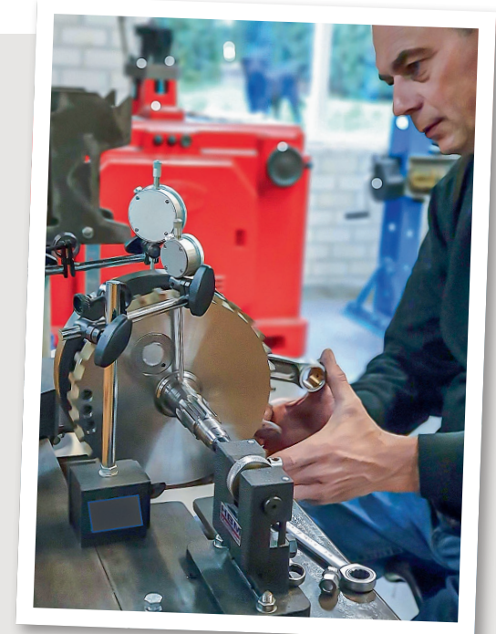
Met dit apparaat kunnen de krukassen van alle H-D-modellen tot en met de Twin Cam- en M8-modellen worden gericht.