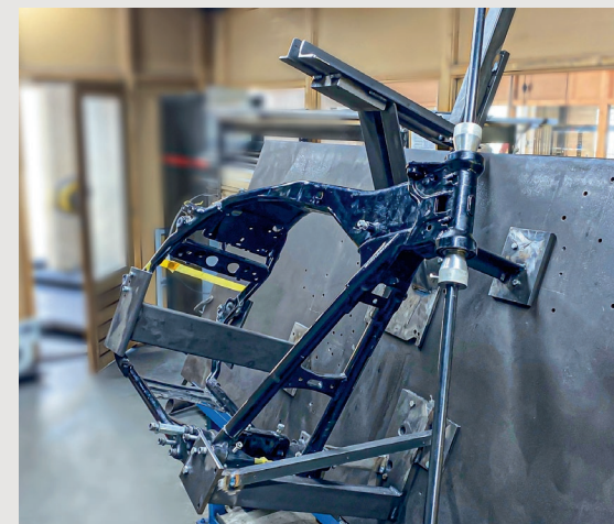
Het richten van Harley-Davidson-frames behoort ook tot de services van het bedrijf.